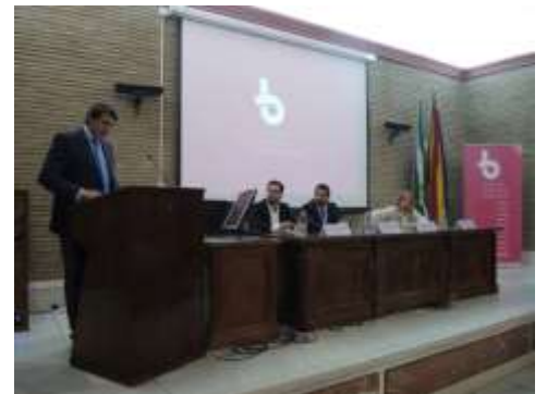
Acto de Inauguración