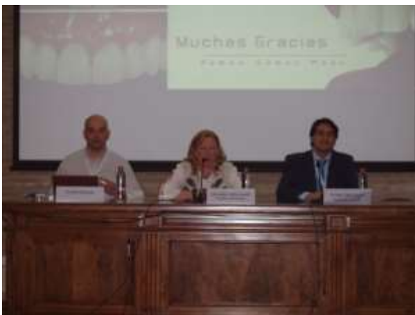
Acto de Clausura